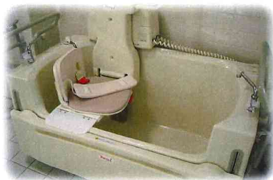
身体状況に合わせた浴槽